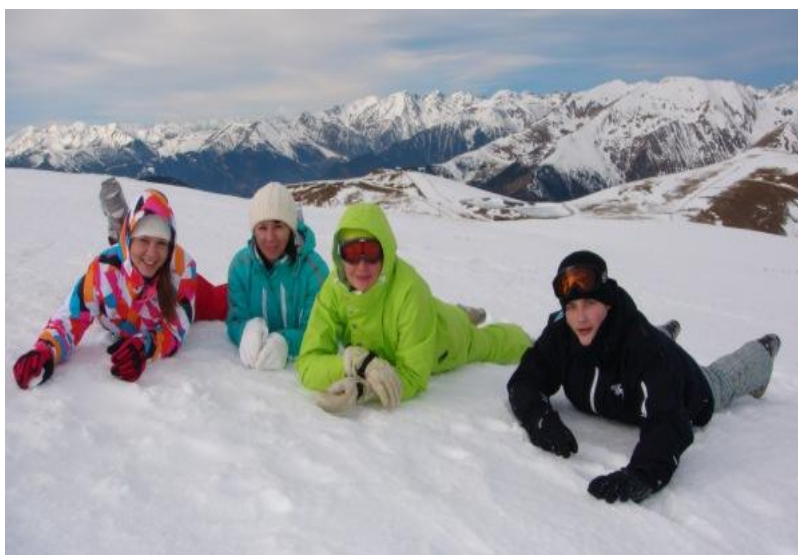
«Все в Андору!», Фото Саши Быковой 11 «Г»

легко достать, заглянув к старшеклассникам.