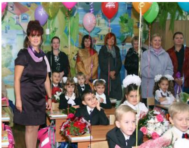
Первый раз - в первый класс!

предстоит пройти дорогой тайн и открытий, покоряя на своем пути таблицу умножения, теорему Пифагора и произведения великих писателей. Волнуются не только первоклассники, но