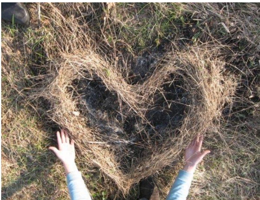
Где вы провели лето?