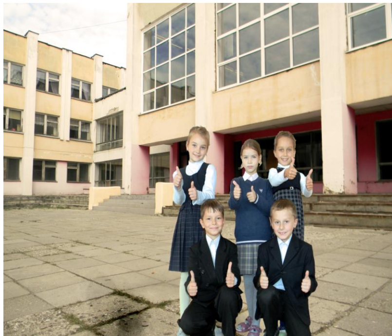
Фото Данила Аксенова 11 «Г»